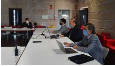
Un intre da sesión