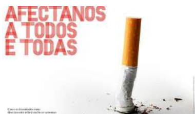
O obxectivo desta iniciativa é concienciar á comunidade universitaria

atlanTTic, Cinbio e CIM son os tres centros de investigación da Universidade de Vigo que formarán parte da marca Cigus, Centro de Investigación do Sistema Universitario Galego, un novo selo identificativo no que se está a traballar desde o executivo galego e que, tal como anunciou este venres o presidente, Alberto Núñez Feijóo, permitirá proxectar Galicia como referente no ámbito científico e investigador, “unha especie de Galicia Calidade da investigación”. +info .