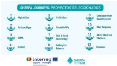
Gráfico no que se amosan o nome dos proxectos seleccionados