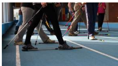
Trátase dunha modalidade de exercicio físico consistente en camiñar empregando uns bastóns específicos

A crise sanitaria non está a permitir que o alumnado de colexios e institutos poida achegarse aos campus a través das xornadas de portas abertas, as actividades divulgativas ou visitas guiadas. Para tratar de manter esta ponte entre a Universidade e o alumnado pre-universitario, a Vicerreitoría de Captación de Alumnado, Estudiantes e Extensión Universitaria deseñou un programa de charlas científico-divulgativas co obxectivo de levar o coñecemento que se xera nas escolas e facultades da UVigo a institutos de toda Galicia. +info .