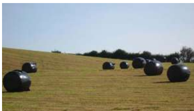
Herba empaquetada con plástico

O Observatorio Municipal Galego fixo pública este venres a súa última análise da situación económica-financeira dos concellos galegos e nela conclúen que “os municipios gozan, en xeral, de boa saúde e, por tanto, están en condicións de reforzar o apoio ás economías locais nestes tempos de crises”. Segundo este observatorio, iniciativa da Rede Localis, rede xestionada polo grupo de investigación GEN da Universidade de Vigo, “os indicadores amosan unha situación económica-financeira saneada, que posibilitaría non só pensar en axudas concretas para favorecer o mantemento do tecido produtivo...”. +info .