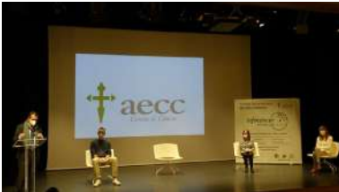
O Concello de Vigo acolleu este mércores un acto para presentar os proxectos seleccionados na provincia

Doce proxectos empresariais de base tecnolóxica do ámbito mariño-marítimo de Galicia e o norte de Portugal van recibir apoio para a súa valorización e posta en marcha a través de Sherpa do Mar, un programa europeo liderado polo grupo de investigación REDE da Universidade de Vigo e no que tamén participan Campus do Mar e a oficina de I+D. +info .