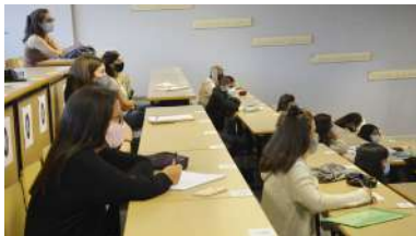
O documento analiza a emigración a outros territorios de persoas de alta cualificación

A situación das mulleres nas universidades españolas amosaba xa unha clara diagnose de desigualdade de xénero e a pandemia non fixo máis que agravar esta situación. Así o amosa o resultado do estudo Xénero e investigación científica na Universidade de Vigo en tempos de covid-19 , unha investigación posta en marcha pola Unidade de Igualdade co obxectivo de analizar o impacto que está a ter a actual situación sanitaria nas carreiras profesionais nas mulleres e homes docentes e investigadores da Universidade de Vigo. +info.