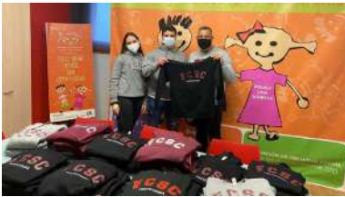
Este venres entregáronse as prendas na sede da asociación Berce

As actividades do programa de prevención de consumo de substancias aditivas A que xogas? Coñece as normas. Ti decides chegaron este venres ao campus de Ourense no seu percorrido polas universidades galegas. Nun posto ubicado no Edificio de Ferro, o alumnado puido recibir “información veraz e contrastada sobre substancias aditivas, co obxectivo de aumentar a percepción do risco que conleva o seu consumo”, segundo indican desde a súa organización. +info .