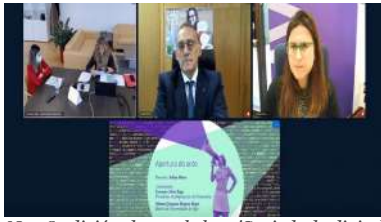
Na 2ª edición do workshop 'Sociedade dixital e xénero. Hackeando o patriarcado'