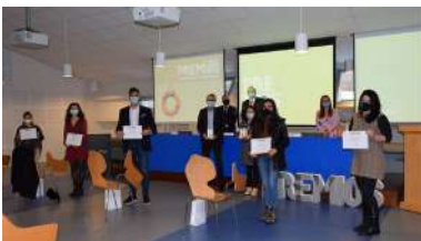
As persoas gañadoras co reitor, o presidente do Consello Social e a vicerreitora de Responsabilidade Social