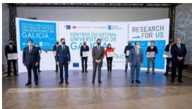
Foto de familia dos responsables dos centros coas autoridades