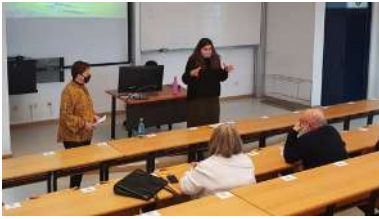
As sesións presenciais desenvólvense no edificio Xurídico-Empresarial