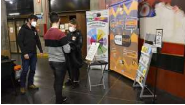
O posto estivo ubicado na entrada do Edificio de Ferro