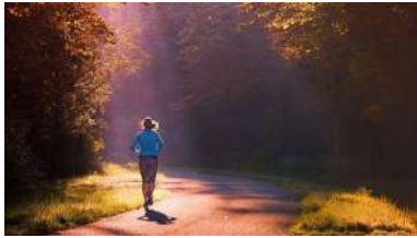
O estudo pon de relevo a importancia de realizar actividade física de forma regular.