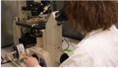
O informe evidencia un escenario de desigualdades no que homes e mulleres “non van no mesmo barco”